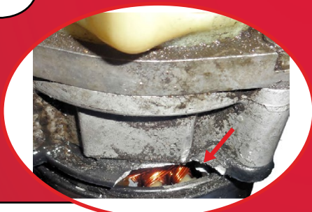
Poškozené odlitky a závity