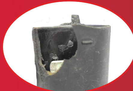
Poškozená nebo prasklá zátka nebo kolíky Přerušené kabely